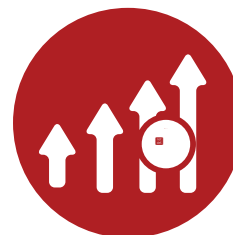
Bónus e descontos