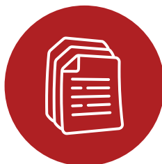
Materiais de marketing