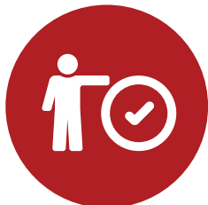
Acesso ao Portal PartnerNet da OKI

Seja qual for o nível de parceria que selecionar, a OKI fornece-lhe diversas ferramentas de suporte