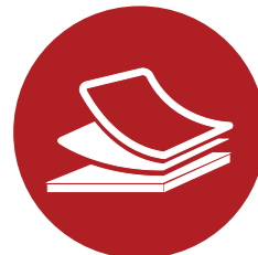
Ferramentas de vendas