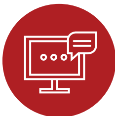
Programa de demonstração